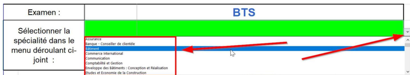
Figure 5: le livret est déjà paramétré pour de nombreux BTS

Le fichier est paramétré pour s'adapter à plusieurs BTS ; il suffit de choisir le BTS concerné et le fichier se met à jour avec les intitulés des enseignements (ou disciplines) de la spécialité de BTS choisie.